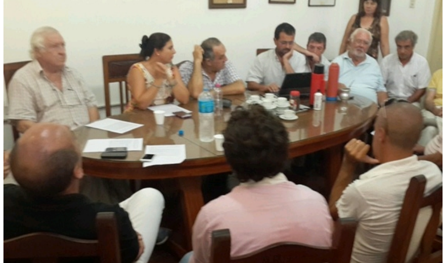
La oposición reclamó una nueva ley electoral.