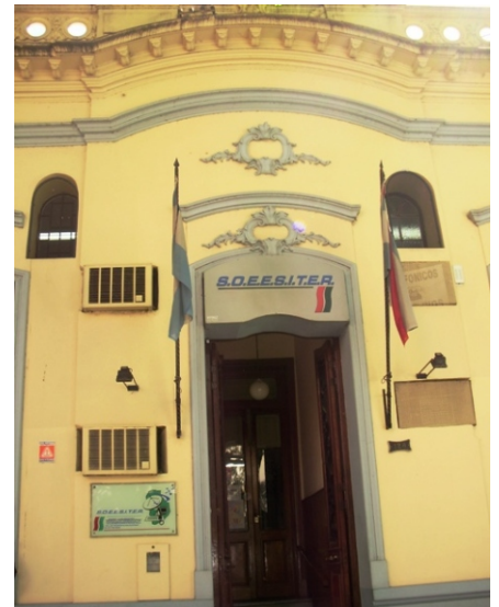
Los telefónicos cargaron duramente contra las prestatarias de servicios

En esta ecuación, "los trabajadores reciben salarios no acordes con el alto volumen actual de tareas, sometidos a la existencia de riesgos laborales, marginados de la participación de las ganancias y con el resultado de un