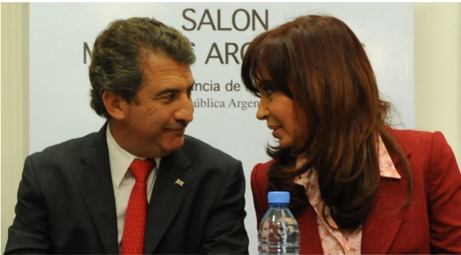
Uribarri se bajó de su candidatura, tras el pedido de Cristina.

Tras el mensaje de Cristina Kirchner la semana pasada por cadena nacional a los dirigentes del kirchnerismo para que disminuya la cantidad de postulantes de cara a las elecciones nacionales primarias, el gobernador de Entre Ríos, Sergio Urribarri, anunció que declina su precandidatura presidencial.