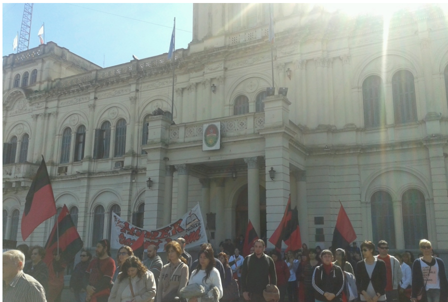
Las protestas más simbólicas de este miércoles fueron en Casa de Gobierno —en la capital entrerriana— y la ruta nacional 14.

Con un contundente paro y acciones en toda la cartografía provincial, los trabajadores de la educación pública se manifestaron para exigir al gobierno que reabra la discusión salarial para el segundo semestre y mejore las condiciones laborales para garantizar el acceso real a la educación pública, confirmó AIM.