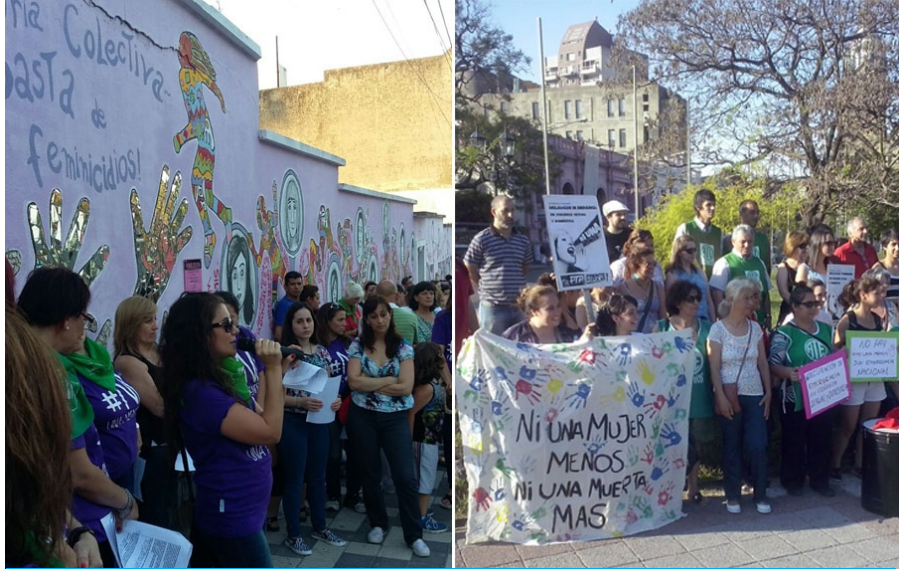
Con dos concentraciones en Paraná, se exigió la emergencia en violencia de género.

En el mural Memoria colectiva, de calle Belgrano, unas 40 organizaciones que adherieron al documento, homenajearon a las víctimas de violencia de género y reclamaron la declaración de la emergencia en torno a esta problemática. La Multisectorial por los derechos de las mujeres, coincidió en el reclamo pero enfatizó en que el responsable de la situación “tiene nombre y apellido y es el gobierno” y apuntó a la ausencia de políticas para combatir el flagelo, registró AIM.