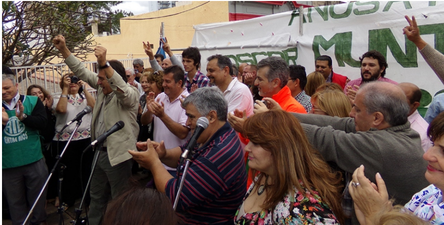
Proclamaron a las autoridades electas de ATE.

Este viernes asumieron las nuevas autoridades de la Asociación de Trabajadores del Estado (ATE) en Entre Ríos, con un fuerte respaldo institucional de la conducción nacional del principal gremio que nuclea a los empleados públicos en la Nación, registró AIM.