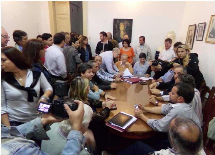
Se firmó el acta acuerdo de Cambiemnos Entre Ríos.