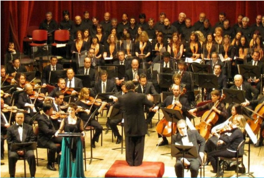
Exigen la creación de cargos para la Orquesta Sinfónica.

Un proyecto de declaración presentado en la Cámara de Diputados busca que el Cuerpo se adhiera a un reclamo "que dé cuenta de la gravísima situación que atraviesan los integrantes de la orquesta, sin justificación plausible alguna y ante la angustiante certeza de perder una vasta extensión del patrimonio cultural entrerriano", registró AIM.