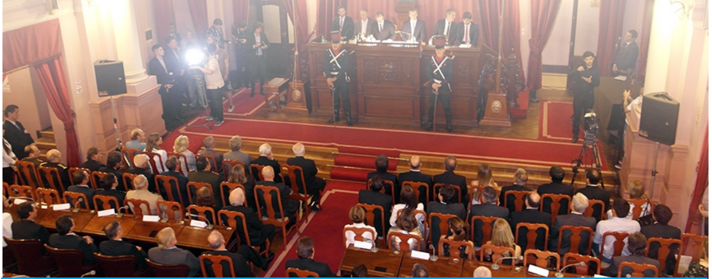
Bordet juró ante la Asamblea Legislativa.

El gobernador de Entre Ríos, Gustavo Bordet, juró ante la Asamblea Legislativa en la Cámara de Diputados. En su discurso informó sobre las líneas generales de su gestión que implicarán un ordenamiento y transparencia de las cuentas públicas, un trabajo conjunto con municipios, el desarrollo y acompañamiento del sector productivo, un fuerte y claro compromiso ambiental y un fortalecimiento de la educación, registró AIM. Además, adelantó que no judicializará el conflicto por la coparticipación.