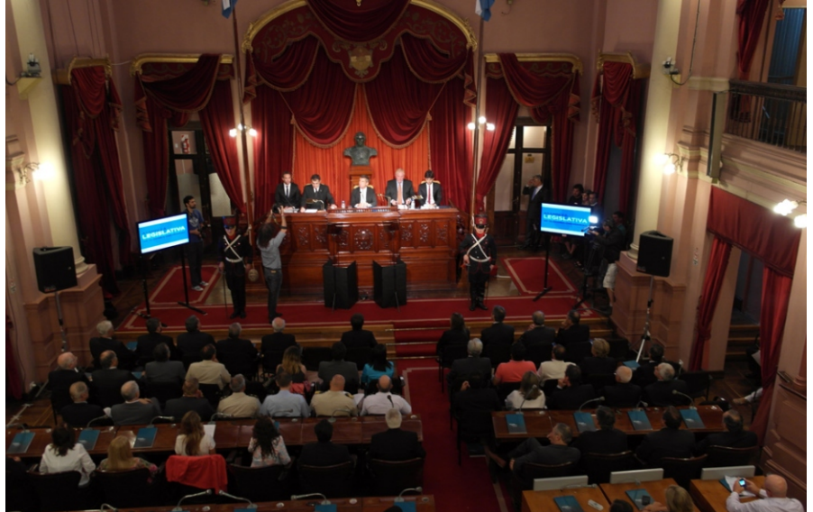
Sin anuncios, Urribarri realizó un ditirambo de su gestión en su último mensaje como gobernador.

En el hemiciclo de la Cámara Baja de la provincia, el gobernador de Entre Ríos, Sergio Urribarri, abrió el 136 período legislativo con su mensaje institucional en el que repasó las obras de infraestructura que se realizaron en sus gestiones, dijo que siempre apostó al diálogo y al consenso y remarcó que su gobierno permitió a la provincia “ponerse en otro nivel”. En el discurso no hubo anuncios. Además, cuestionó a la oposición, registró AIM.