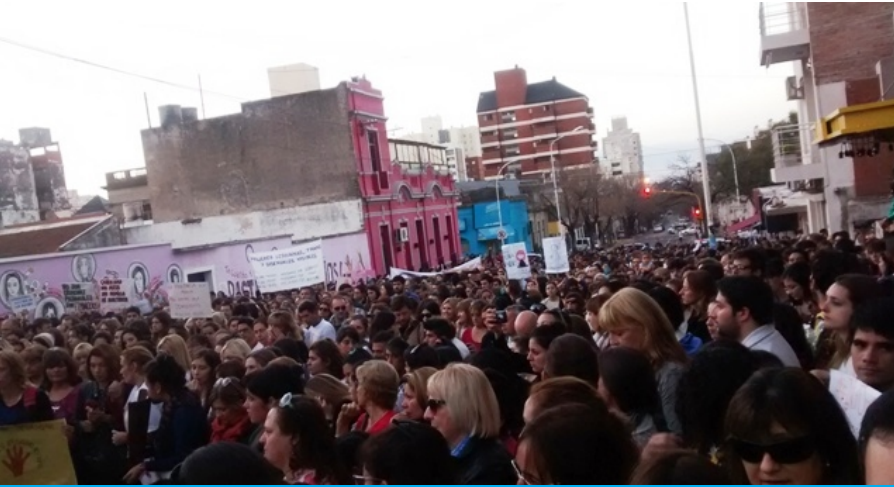
La inauguración del mural, en calle Belgrano.

Con una masiva adhesión, los entrerrianos se manifestaron este miércoles con la consigna #NiUnaMenos, para repudiar la violencia de género y los abusos del patriarcado. En la capital provincial, se inauguró el mural “Memoria Colectiva”, se realizó una concentración en la plaza 1 de Mayo y una marcha a la Casa de Gobierno, para exigir la Ley de Emergencia en Violencia de Género. Fuerte respaldo político e institucional.