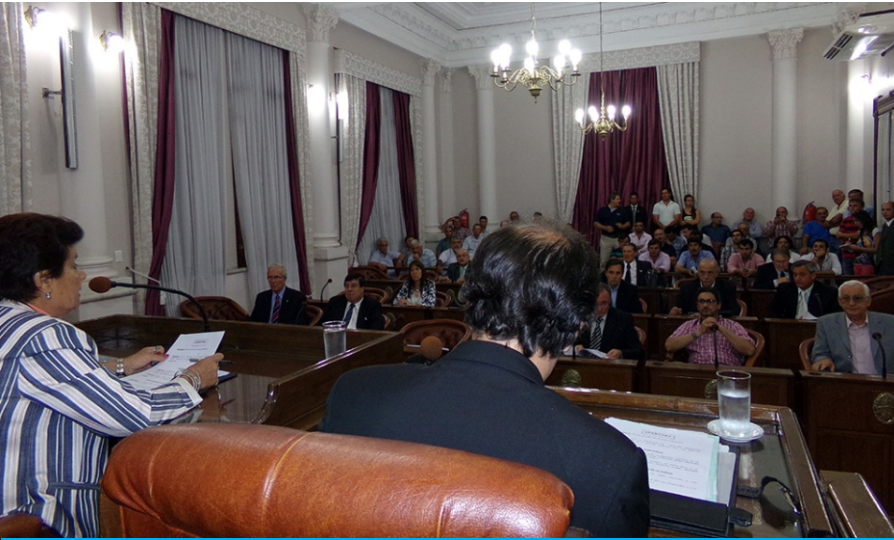
La presión del campo frenó el impuestazo al combustible.

Los senadores oficialistas aprobaron, por unanimidad, archivar el proyecto de Ley que buscaba gravar el combustible en la provincia, ya que consideraron que no es el momento oportuno para sancionarlo y no responde a una política del Ejecutivo provincial. Los productores y transportistas de carga festejaron la decisión, ya que explicaron a AIM que el sector no soporta más cargas tributarias.