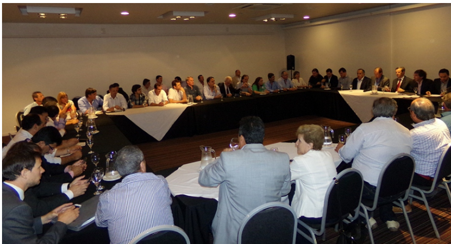
Intendentes de Cambiemos se reunieron con Bordet y su equipo de gobierno.

En la capital provincial, a unos 800 metros de Casa de Gobierno, intendentes electos por Cambiemos se reunieron con proclamado gobernador, Gustavo Bordet, y sus funcionarios, para plantearle el estado financiero de las comunas y la necesidad de que se giren fondos de coparticipación en tiempo y forma, confirmó AIM.