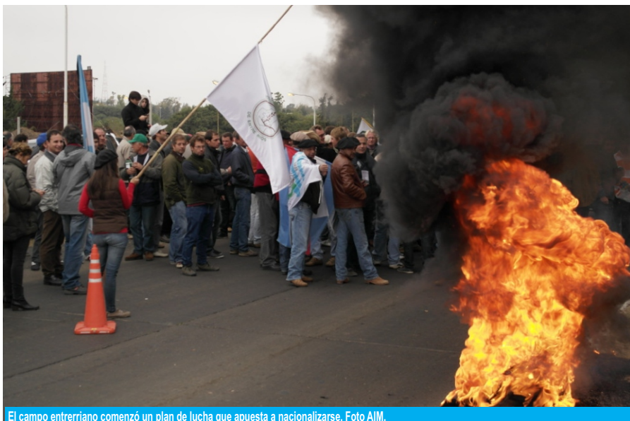
El campo entrerriano comenzó un plan de lucha que apuesta a nacionalizarse.

Productores acompañados por empresarios y cooperativistas realizaron una jornada de protesta este jueves en el acceso a la capital entrerriana, para reclamar al gobierno un plan de salvataje para el sector, ante la falta de rentabilidad, la alta presión tributaria y la ausencia de fuentes de financiamiento. El plan de acción sería la punta de lanza de jornadas nacionales de lucha, indicaron a AIM. El 30 habrá otra manifestación.