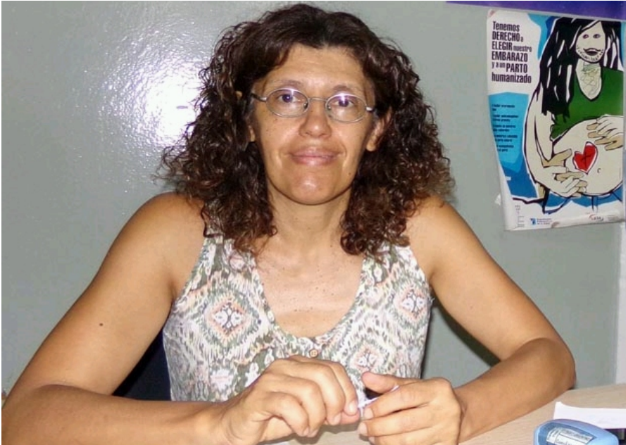
Las principales denuncias al Inadi fueron por discriminación por orientación sexual o identidad de género en Entre Ríos.