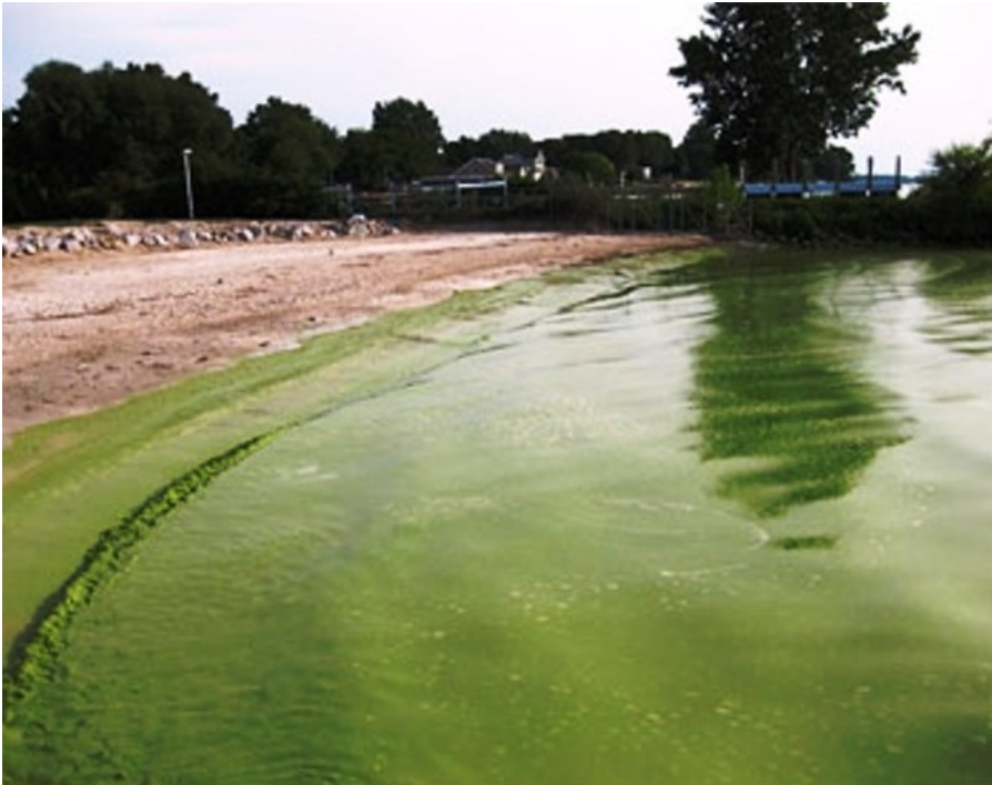
Preocupa la presencia de algas en las costas del Uruguay.

En vacaciones, la mayoría de las personas se preocupa por los peligros de las altas temperaturas o por la exposición al sol en horarios desaconsejados, pero según los informes de la Comisión Administradora del Río Uruguay (Caru), en algunas de las playas de ambas costas es recomendable no ingresar al agua debido a la presencia de floraciones algales, se informó a AIM.