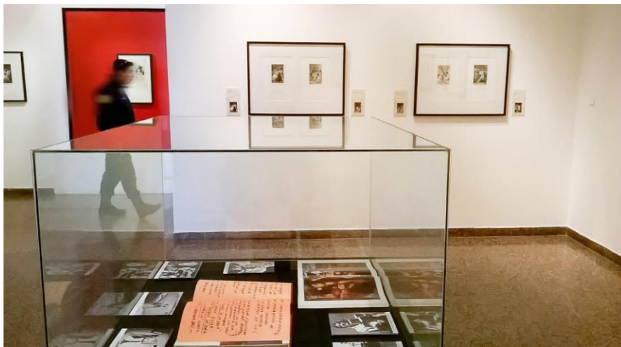
Muestra 'Goya-Dalí: Un encuentro surrealista'.