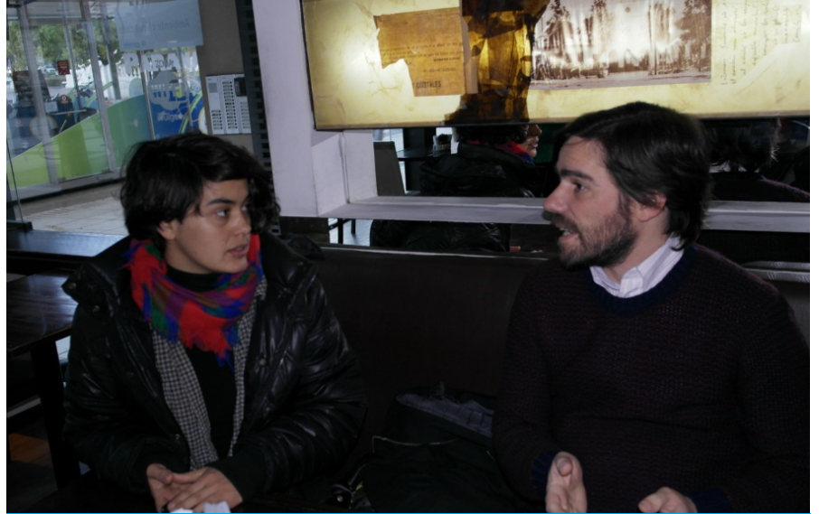
Del Caño presentó la precandidata entrerriana al Parlasur y aseguró que el FIT "es la única alternativa a los políticos del ajuste".

El precandidato a presidente del Partido de los Trabajadores Socialistas (PTS) dentro del Frente de Izquierda y los Trabajadores (FIT), Nicolás Del Caño, estuvo en Paraná junto Noelia Gipler, precandidata al Parlasur, para dar a conocer a los entrerrianos las principales propuestas políticas de la lista 1 A Renovar y Fortalecer el Frente de Izquierda, de cara a las Primarias, Abiertas, Simultáneas y Obligatorias (Paso). El diputado nacional indicó a AIM que apuestan ampliar el margen de electores ya que son "la única alternativa a los políticos del ajuste".