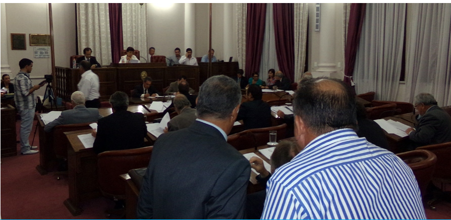
El Senado sancionó la derogación del impuesto al juego y pasó a cuarto intermedio antes de tratar la reforma a la Ley electoral

La Cámara de Senadores sancionó el proyecto que deroga el impuesto a los juegos de azar, maquillada con la creación de un Fondo Provincial de Seguridad (Foprose), registró AIM.