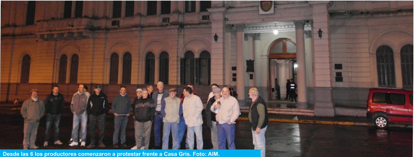
Desde las 6 los productores comenzaron a protestar frente a Casa Gris.