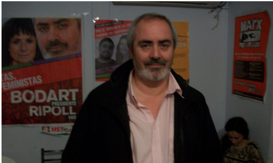
Para Bodart, “la izquierda crece porque sus propuestas empalman con el sentimiento de la gente”.

El precandidato a presidente del MST Nueva Izquierda, Alejandro Bodart, estuvo en Paraná para difundir su plataforma electoral de cara a las elecciones primarias de agosto. Se mostró confiado en que esa fuerza política pueda acceder a una banca por primera vez en la legislatura entrerriana y, al enumerar las propuestas que hacen énfasis en “solucionar el enorme déficit social” dijo a AIM que estas ideas “empalman con el sentimiento de la gente, por eso la izquierda crece”.