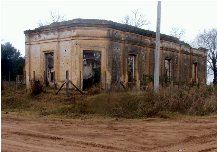
Casas vacías, consecuencia del éxodo rural, un flagelo que crece.

El éxodo rural, un flagelo que crece en el interior profundo de la provincia, que deja pueblos fantasmas, escuelas vacías y jóvenes sin sueños, tiene su contracara en aquellas personas que trabajan denodadamente en la consolidación de lazos sociales para generar las condiciones de posibilidad para las nuevas generaciones. “Para que los jóvenes se queden en su lugar, hay que romper la estructura burocrática del Estado, burocracia que no se ve en otros proyectos”, afirmó a AIM el ingeniero Agrónomo Pablo Benetti.