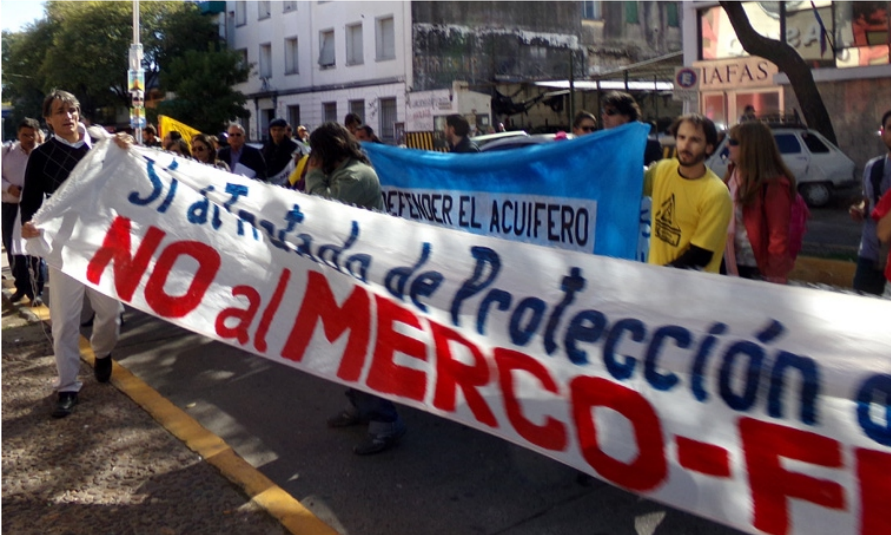
Tras un break, los participantes marcharon con cánticos y banderas desde la Universidad al edificio donde funciona el Juzgado Federal.

Investigadores, estudiantes, docentes, activistas y ambientalistas de diferentes puntos de América participan de la cuarta cumbre nacional anti-fracking y de la segunda cumbre internacional, donde comenzaron a advertir sobre las consecuencias sociales y ambientales de la práctica, registró AIM. También, se realizó movilización al Juzgado Federal en Paraná para repudiar la criminalización de la protesta social.