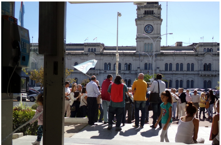
En abril, la multisectorial presentó una demanda por inconstitucionalidad de la Ley 10.352.