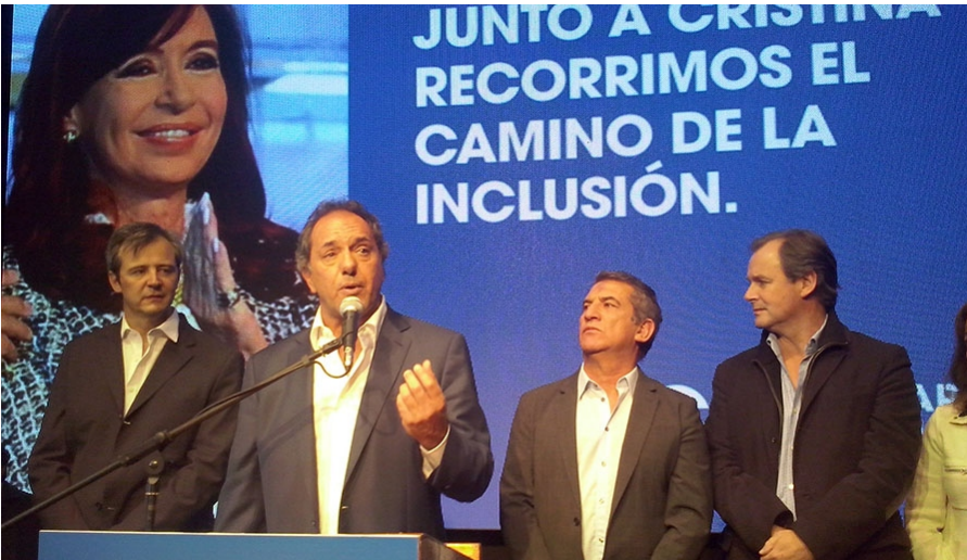
Scioli estuvo en Paraná y se llevó el apoyo del urribarrismo.

El gobernador de Buenos Aires y precandidato a Presidente del oficialismo, Daniel Scioli, encabezó un acto en Paraná junto con su par de Entre Ríos, Sergio Urribarri. Lejos de las duras críticas de cuando aún aspiraba a la presidencia, el mandatario entrerriano no tuvo más que elogios para el bonaerense, que se fue de la provincia con elogios y respaldos de viejos detractores.