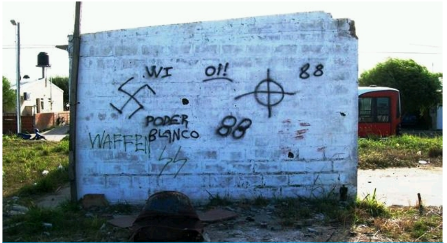
La aparición de pintadas discriminatorias ya no es noticia.

La pared blanca decía: "Hitler vive"; "debemos asegurar la existencia de nuestra raza y un futuro para los niños arios", y "poder blanco", combinado con cruces esvásticas de un negro profundo. Estas leyendas aparecieron con mayúsculas meses atrás en los muros de la comisión vecinal Eva Duarte de Perón, del barrio 400 Viviendas de Colonia Avellaneda. Aunque se desconocen los autores, la reacción de la comunidad no se hizo esperar y desde la escuela 31 "Pueblos Originarios" organizan actividades para concientizar sobre discriminación y el contexto histórico al que remiten las frases y símbolos, se informó a AIM.