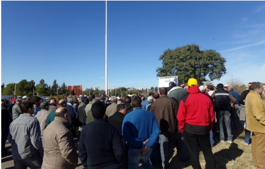
Productores, otra vez en la ruta.

Cientos de productores agropecuarios protestaron este miércoles en Entre Ríos, en el acceso al Túnel Subfluvial, en Paraná, y en el emblemático kilómetro 53 de la ruta nacional 14 en la lucha de 2008, para exigir cambios en la política agropecuaria, demandar al gobierno provincial que se ponga al frente del reclamo, y advertir que si no hay respuesta, recrudecerá la lucha. Ciudadanos rurales se apostaron a la vera de las rutas para debatir en asamblea, entregar panfletos, y explicar a los automovilistas que el campo necesita políticas adecuadas para no desaparecer.