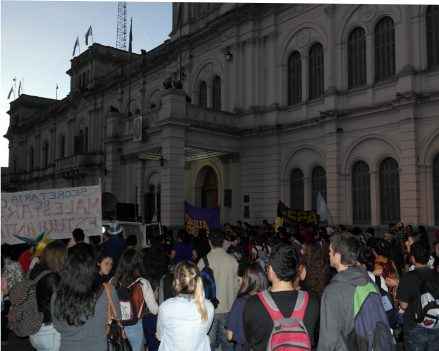
Una multitudinaria marcha de estudiantes y docentes reclamó por el campus para la Uader.

Una contundente movilización de estudiantes y docentes de la Universidad Autónoma de Entre Ríos (Uader) protestó desde la escuela Normal hasta Casa de Gobierno, donde se realizó una asamblea para reclamar al Estado que garantice el derecho a la educación superior con el campus universitario y mayor presupuesto para la institución, registró AIM. Acompañaron la jornada partidos de izquierda y organizaciones sindicales. Además, se aprobó otra protesta y se entregará un petitorio al gobierno.