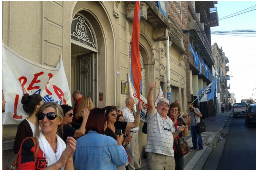
Absolvieron a los asambleístas de Gualedguaychú y hubo festejos en la puerta del Tribunal.