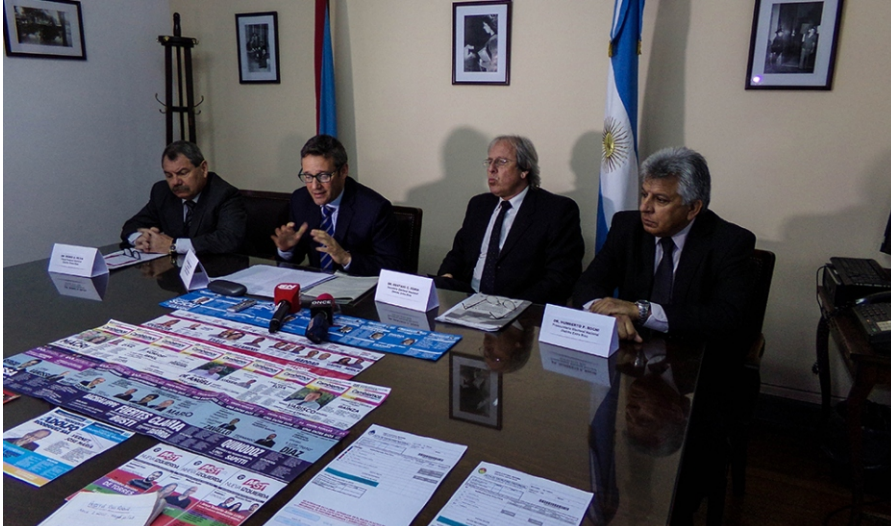
La Justicia se mostró presta a actuar ante cualquier delito o falta el próximo domingo.

Autoridades de la Justicia Federal, del Ministerio Público Fiscal y de la Junta Electoral nacional del distrito Entre Ríos remarcaron las garantías del proceso electoral, destacaron las medidas tendientes a publicitar de un modo más eficaz todas las instancias de traslado y gestión de las boletas y urnas y destacaron la diligencia para actuar ante cualquier falta o delito el próximo domingo, registró AIM. Ante cualquier irregularidad, los ciudadanos podrán realizar las denuncias de forma personal, por teléfono o vía web.