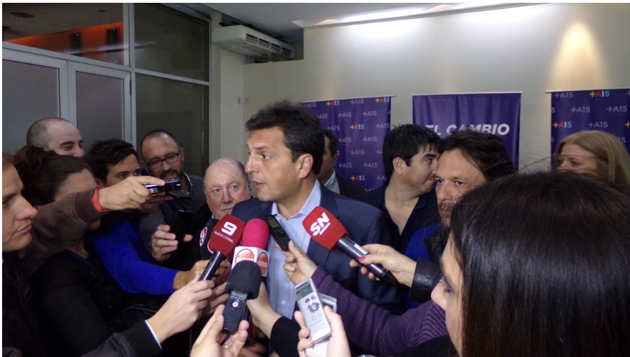
Massa: “Los entrerrianos votarán el cambio con un gobierno serio, no darán un salto al vacío”.

El candidato a presidente por el frente Unidos por Una Nueva Alternativa (UNA), Sergio Massa, respaldó fuertemente en Paraná la fórmula que lleva como candidatos a Adrián Fuertes y Jorge Busti, y aseguró a AIM que los entrerrianos “votarán el cambio con un gobierno serio; no darán un salto al vacío”. Además, se distanció de Mauricio Macri y cuestionó a Daniel Scioli.