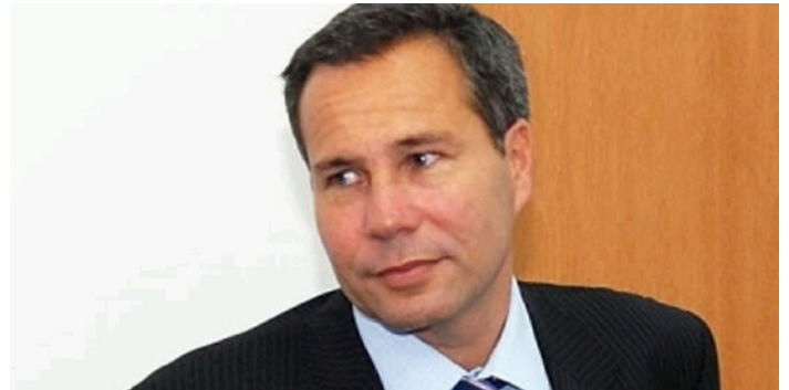
Profunda consternación de Daia por la muerte de Nisman.

Para el dirigente de Daia, es demasiado pronto para emitir juicios. Sin embargo visualizó “un antes y un después en la causa Amia. A nivel institucional será un hito, por las circunstancias en que se dio. Nisman había hecho una denuncia muy fuerte hace unos días, y que ahora aparezca muerto, es un golpe muy fuerte. Más allá del tema procesal, y de la causa misma, hay una cuestión institucional y política que excedía la denuncia, y hoy creo que esa cuestión está más presente que nunca”.