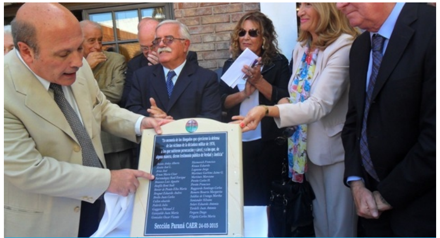
Descubren una placa con el nombre de abogados valientes y abnegados en la época de la dictadura.