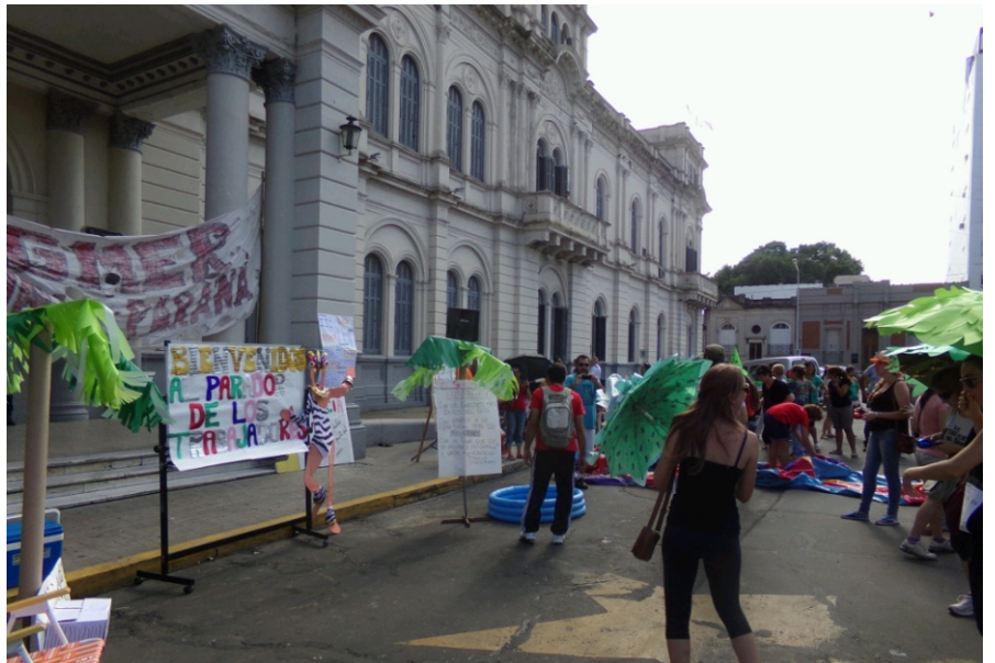
La los docentes instalaron 'El parador de los trabajadores' en la explanada de Casa de Gobierno.

Los docentes nucleados en la Asociación Gremial del Magisterio de Entre Ríos (Agmer) Paraná realizaron una sátira del parador del gobierno de Entre Ríos en Mar del Plata, para reclamar que los sueldos se paguen en tiempo y forma y apertura de la paritaria salarial, registró AIM. Además, exigen a la Comisión Directiva Provincial (CDC) del gremio que realice un congreso para forzar a la patronal a sentarse a discutir una urgente recomposición y mejores condiciones laborales.