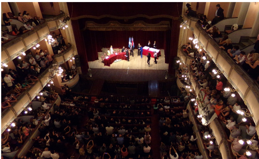
Proclamaron a las autoridades provinciales electas.