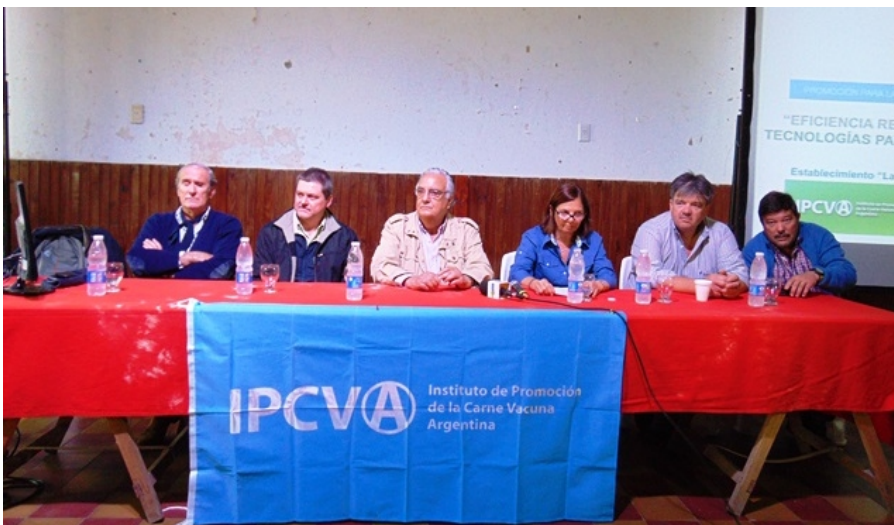
El panel, en la apertura de la actividad.

El mal tiempo no impidió que el Instituto de Promoción de la Carne Vacuna Argentina (Ipcva) realizara este viernes una exitosa jornada con un temario adaptado a la región del norte entrerriano, que contó con la participación de más de 300 productores y disertaciones de técnicos del Inta, del organismo y asesores privados, registró AIM. La actividad, que estaba prevista en el Establecimiento "La Colorada", a 11 kilómetros de la rotonda de Los Conquistadores (departamento Federación), debió trasladarse a Feliciano.