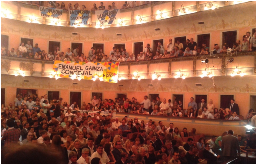
Proclamaron las autoridades del departamento Paraná y hubo incidentes.

La Junta Electoral del principal distrito entrerriano proclamó 301 autoridades electas en el teatro 3 de Febrero de la capital. En la sala los cánticos de Cambiemos se superponían con los del cámporismo y Renacer peronista, en el hall hubo golpes y forcejeos, registró AIM.