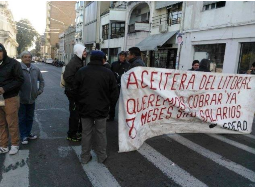
Trabajadores de la aceitera volvieron a reclamar en la calle.