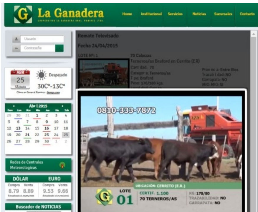
La Ganadera es la primera cooperativa entrerriana que televisa sus remates.

La cooperativa La Ganadera de General Ramírez marca el paso en Entre Ríos, ya que comenzó a televisar sus remates, para ampliar el mercado y reducir costos a los productores, registró AIM. En la primera subasta se pusieron a la venta 1800 animales.