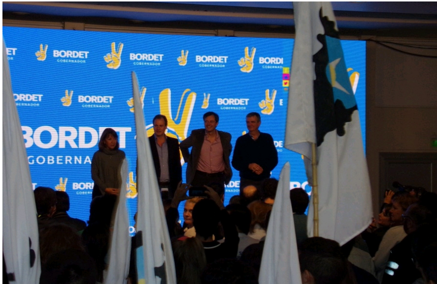
Bordet se adjudicó el triunfo e hizo “una amplia convocatoria para redoblar los votos”.

El candidato a gobernador por el Frente para la Victoria, Gustavo Bordet, instó a los militantes a redoblar los esfuerzos y realizó una amplia convocatoria a las líneas internas para trabajar en conjunto “para obtener un triunfo más contundente en octubre”, en un acto que se realizó en el bunker del oficialismo, en uno de los principales hoteles de la capital entrerriana, registró AIM. La intendenta Blanca Osuna, quien se impuso ante las otras fórmulas locales del oficialismo, se plegó al llamado del delfín de Sergio Urribarri.