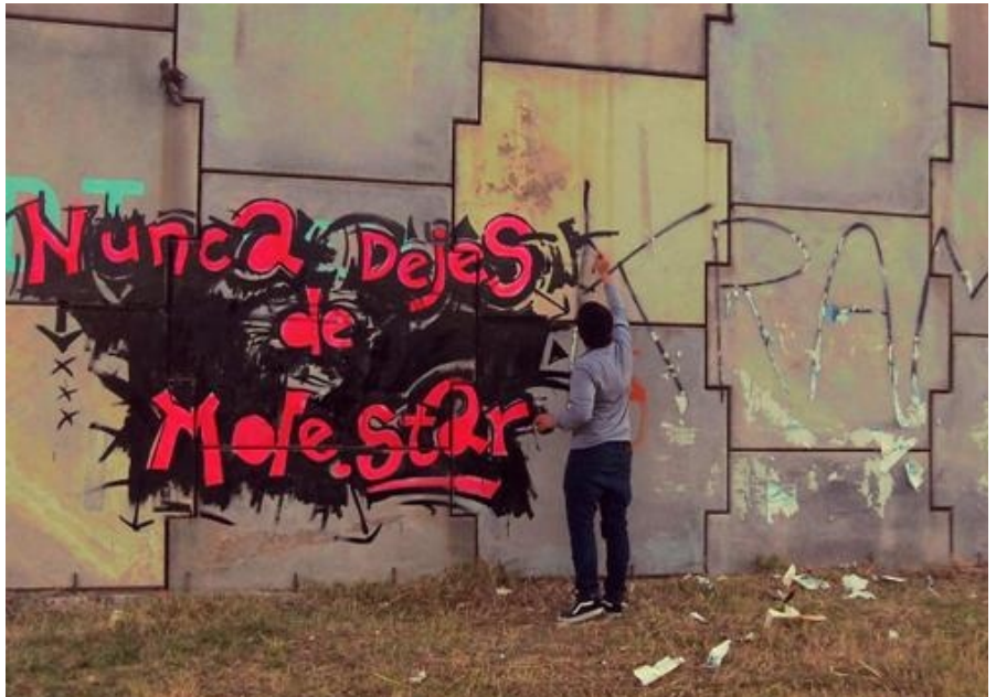
Cultura Mosca, siempre molestar.