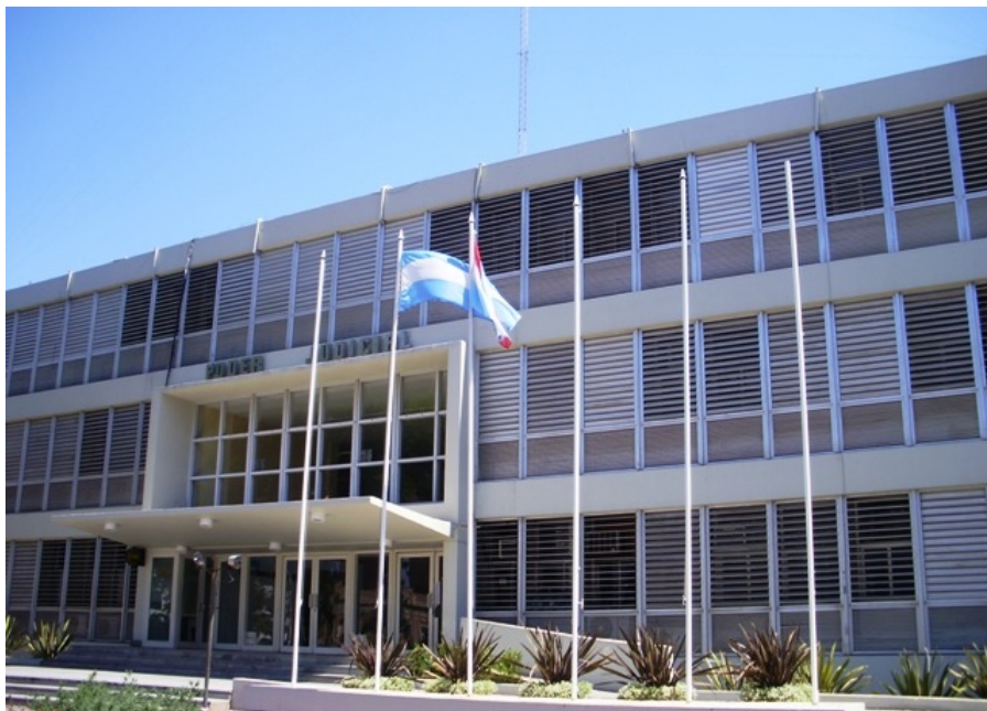
Fachada del poder Judicial.