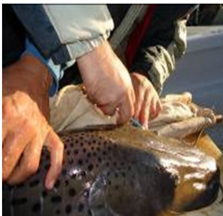
Colocación de dardo.

Es necesario recordar que en la primera década del siglo XXI en ciertas áreas del río Uruguay se produjeron concentraciones excepcionales de ejemplares de gran tamaño de surubí pintado ( pseudoplatystoma corruscans ), considerados particularmente valiosos como reproductores, dando lugar a una pesca excesiva, de difícil control y favorecida por la alta vulnerabilidad de los peces en dicha situación, por lo que se