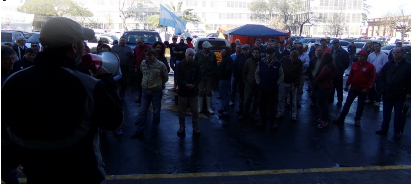
La asamblea se declaró en "estado de alerta y movilización".

Luego de cinco días de protesta frente a Casa de Gobierno los chacareros que realizaron el acampe levantaron la campaña pero no renunciarán a la lucha, ya que la asamblea se declaró en "estado de alerta y movilización", impulsó una marcha para el 6 de agosto al Banco Nación Argentina de Paraná y definió interceptar al gobernador Sergio Urribari en cada localidad a la que vaya. El gobierno recibió a los productores y comunicó un acuerdo con YPF, subsidios nacionales para la lechería y líneas de créditos para tamberos y cítricos, registró AIM.