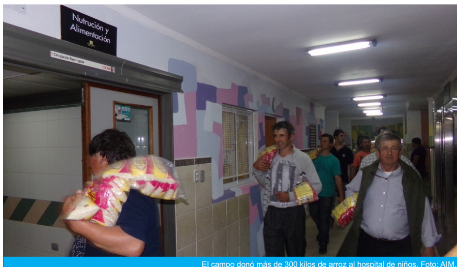
El campo donó más de 300 kilos de arroz al hospital de niños.

montaron las carpas y la asamblea logró hablar con el ministro de la producción, Roberto Schunk; en la segunda jornada, reclamaron a Urribari que los reciba y comience a resolver los problemas del sector; el miércoles, se expuso la crisis de la lechería con terneros apostados en la puerta de la Casa Gris; el jueves, los arroceros difundieron la situación, regalaron el producto a los transeúntes y donaron solidariamente más de 300 kilos al hospital materno infantil San Roque; y este viernes le tocó a la citricultura dar a conocer el panorama desolador.