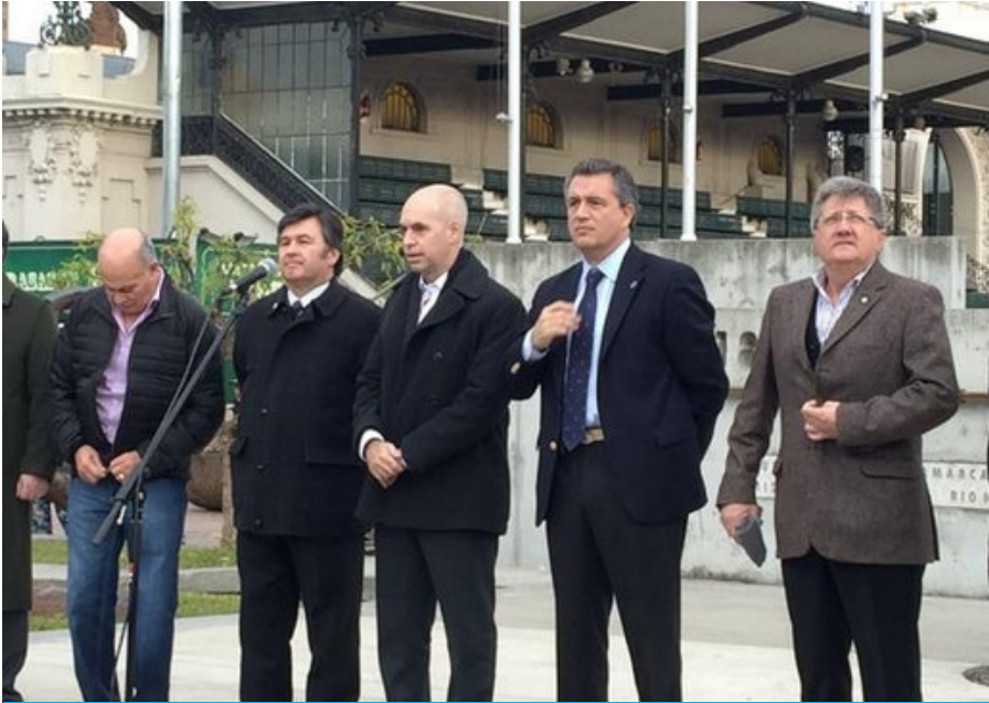
Este jueves comenzó la Rural de Palermo. AIM.

La agenda de la 129ª Exposición Rural que se realiza desde este jueves al 2 de agosto está guiada por una fuerte influencia de dos entrerrianos que marcan el paso del sector agropecuario en una feria que trasciende su propia magnitud por el impacto internacional de los productos de vanguardia del país en ese sector y por la influencia que ejerce sobre la política nacional, registró AIM.