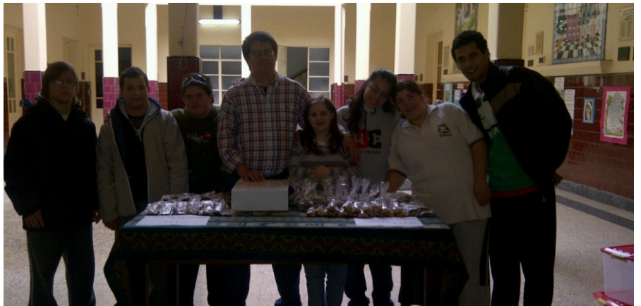
Correrse del lugar y abrir nuevos mundos.

El taller de cocina del Centro Privado Educativo Integral (Cpei) N° 30 es una apuesta que combina aromas, sabores y estrategias de interacción con lo cotidiano, en el que el juego estimula aprendizajes para que los jóvenes con discapacidad puedan llevar su vida de forma autónoma, en la que no sólo aprenden a solucionar sus necesidades sino que les abre las puertas para que ofrezcan lo que producen.