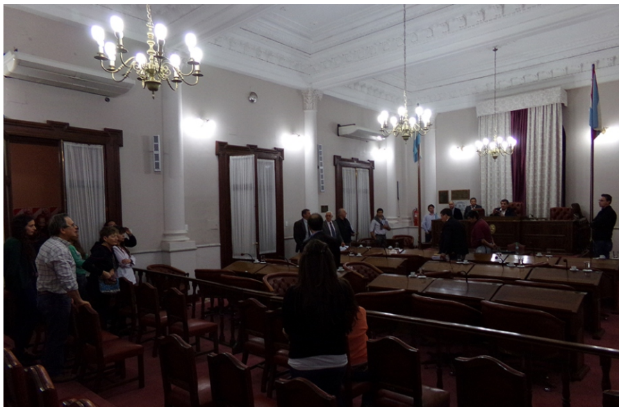
Activistas protestaron al cierre de la sesión, registró AIM.

La Cámara de Senadores sancionó con fuerza de Ley el proyecto por el que se creó la Jefatura de Gabinete, a tres meses de que concluya la gestión. Además, volvió a comisión la iniciativa que busca establecer una nueva regulación sobre el uso de agroquímicos en la provincia. Activistas protestaron al cierre de la sesión, registró AIM.