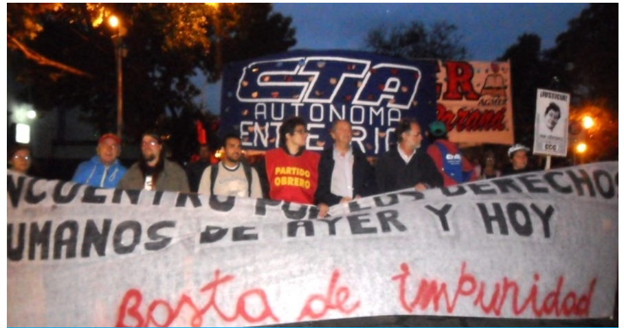
El Encuentro por los derechos humanos marcha hacia la Casa Gris.

Representantes de organizaciones políticas, gremiales y sociales nucleadas en el "Encuentro por los derechos humanos de ayer y de hoy", y la "Multisectorial por los derechos humanos", marcharon este martes en el Día de la Memoria por la Verdad y la Justicia, en repudio al golpe de Estado del 24 de marzo de 1976, registró AIM. Los primeros culminaron en Casa de Gobierno con la lectura de un crítico documento a los gobiernos nacional y provincial, mientras los segundos terminaron con un acto artístico en Plaza Alvear.