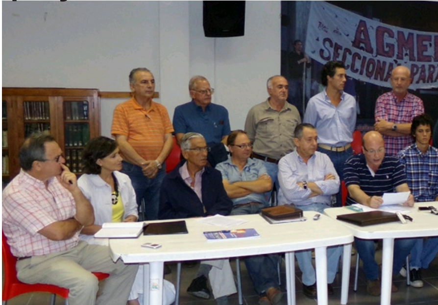
Una amplia multisectorial solicitó a legisladores entrerrianos que frenen el 'proyecto chino'.

Este martes, organizaciones no gubernamentales, sindicatos, proyectos de extensión de universidades públicas, partidos políticos y entidades que representan a los productores entrerrianos presentaron en la Cámara de Diputados un documento en el que pidieron a los legisladores el freno inmediato del tratamiento de la iniciativa que faculta al Ejecutivo a tomar un crédito por 430.387.551 millones de dólares con bancos estatales y aseguradoras de crédito chinas para realizar un acueducto exclusivamente con China State. Además, reclamaron la más amplia información y transparencia de los actos de gobierno; la convocatoria a los múltiples sectores involucrados; y la necesidad de que se realicen las consultas necesarias a organismos públicos y no gubernamentales, registró AIM.