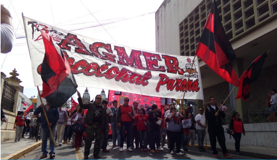
Miles de trabajadores marcharon hasta Casa de Gobierno.

Con un contundente paro y una masiva marcha en la capital entrerriana, los docentes de la provincia se construyen como la punta de lanza de la clase trabajadora que resiste la destrucción del sistema educativo público y se opone al ajuste que descarga el gobierno sobre los asalariados. Exigen a la gestión de Sergio Urribarri que recomponga el salario y genere las condiciones de posibilidad para que la educación sea realmente garantizada, registró AIM.